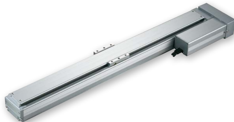
(注) 上写真はモーター左折返し仕様 (ML) です。